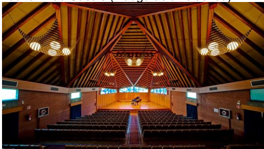
Museu Pau Casals (tallers)

Auditori Pau Casals (inauguració i cloenda)