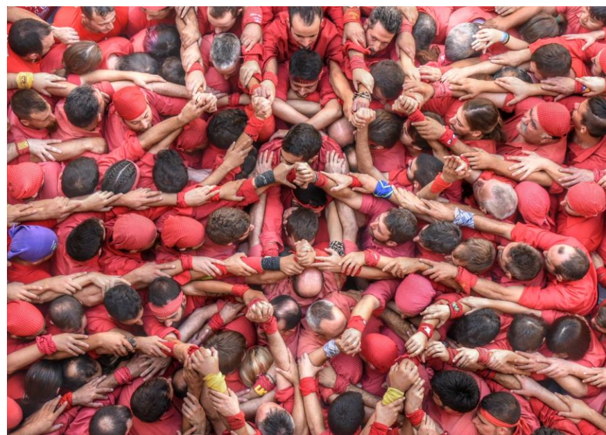
La Colla dels Nens del Vendrell