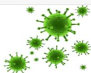
5 Accions Xarxa sobre Tabac i COVID-19