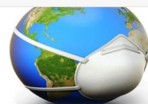
Fumar agreuja el risc de complicacions pel coronavirus