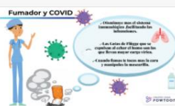
Posicionament de les autoritats sanitàries sobre consum de tabac i la COVID-19