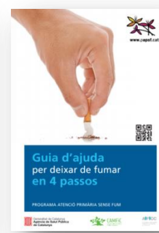
1a edició fins 2019