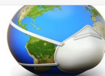
Fumar agreuja el risc de complicacions pel coronavirus