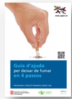
1a edició fins 2019