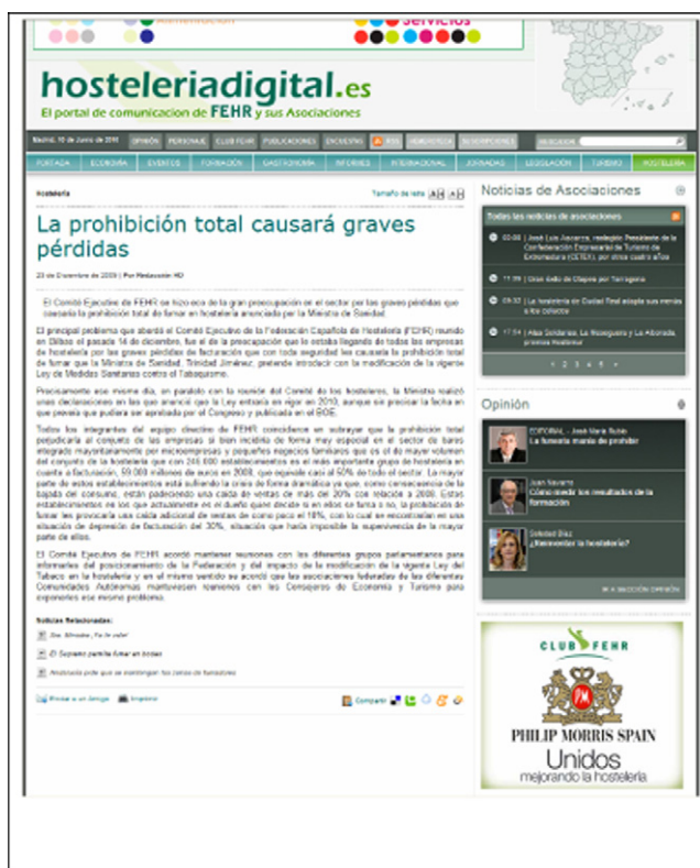
Figura 2 Página web de la FEHR en la que aparece el logo de Phillip Morris como patrocinador.

algunos argumentos esgrimidos habitualmente tanto por la industria hostelera como por la del tabaco: a) no se ha demostrado una relación causal entre respirar aire contaminado por humo de tabaco de los demás y el desarrollo de enfermedades; b) hay fuentes más importantes de contaminación ambiental; c) las áreas compartidas para fumadores y no fumadores solucionan el problema; d) la exposición al humo de tabaco de los demás es solo un tema de mala ventilación; e) los ambientes libres de humo perjudicarán a los negocios, especialmente a los bares y restaurantes, y a la industria turística; f) los gobiernos no tienen derecho a decirle a los comerciantes qué hacer; y g) la restricción de fumar vulnera los derechos de los fumadores.